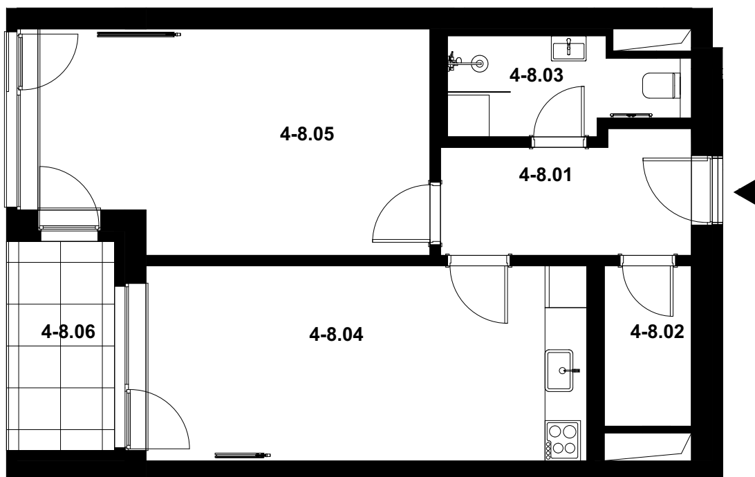
POLOHA JEDNOTKY V RÁMCI PODLAŽÍ budova U