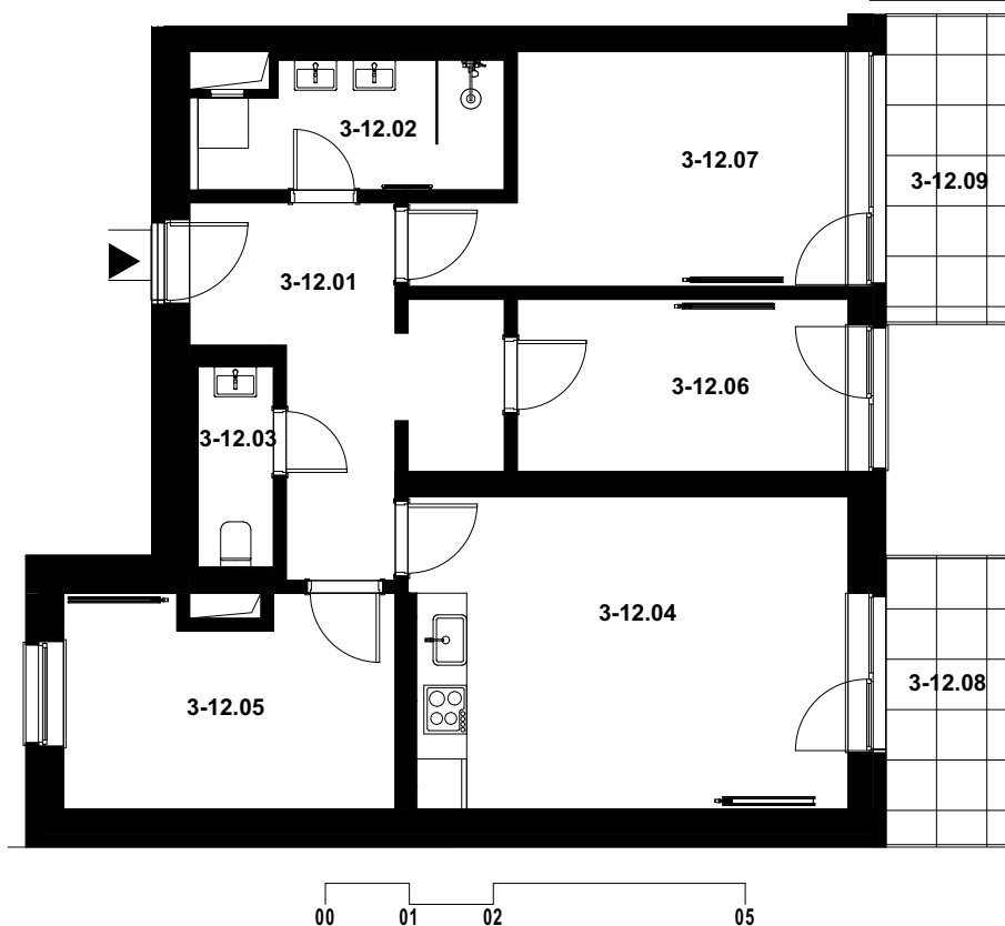
POLOHA JEDNOTKY V RÁMCI PODLAŽÍ budova D